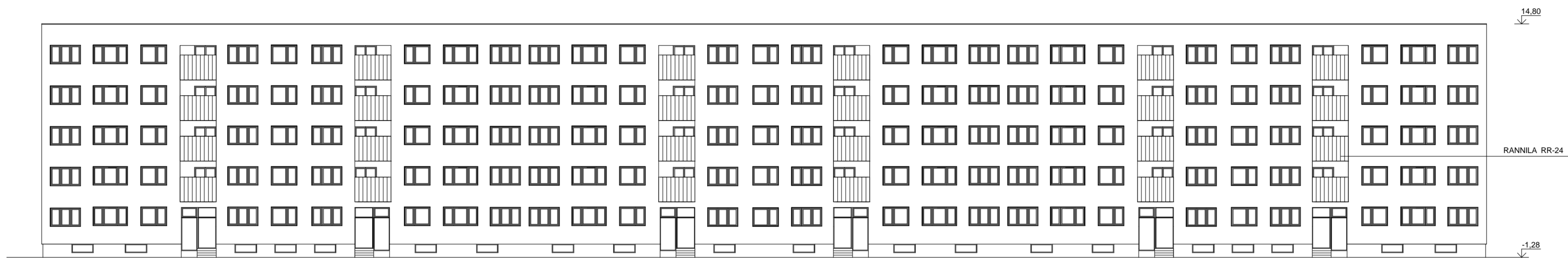
Fragment 1 (vaata leht AE-2)