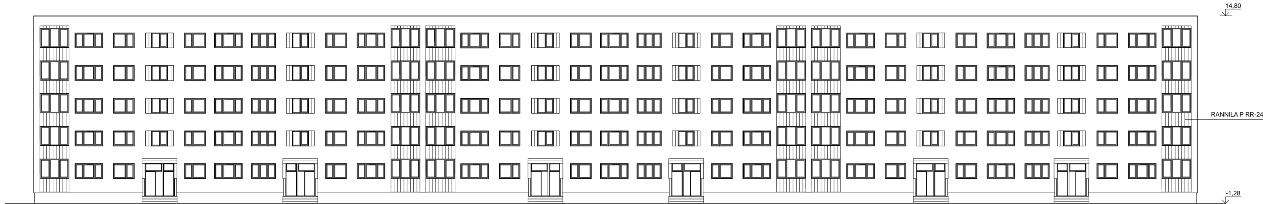
Fragment 2 (vaata leht AE-3)