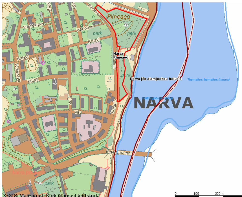
Joonis 2. Kaitstavad alad ning kaitstavate liikide leiukohad Narva vanalinnas ning selle lähiumbruses.